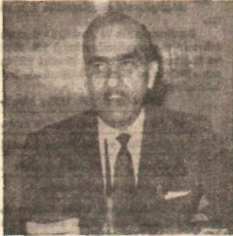
Adalet Bakanı Kurutluoğlu

C H.P. Meclisinde «sürgündeki ağalar» meselesi oldukça hareketli tartışmalara yol açtı. Bazı Parti Meclisi üyeleri, ağaların kayıtsız şartsız dönmesi fikrinin, hükümet tarafından benimsenmesini tenkit etti. Mesela Van'ın en zengin aşası olan Kinyas Kartal'ın durumu ortadaydı. Kinyas Kartal'ın tahminlere göre 60 bin, tepu kayıtlarına göre 35 bin dönüm arazi vardı. Bu arazinin 10 bin dönümünde ziraat okulları açılması, gerisinin topraksız çiftçilere dağıtılmak üzere kamulaştırılması kararlaştırılmıştı. Fakat İnönü hükümeti, sürgündeki ağaların mallarına dokunulmaması için emir verdi. Kinyas Kartal, pek yakında Van'a dönünce, mallarına kavuşacak. Muhtemelen A.P. li