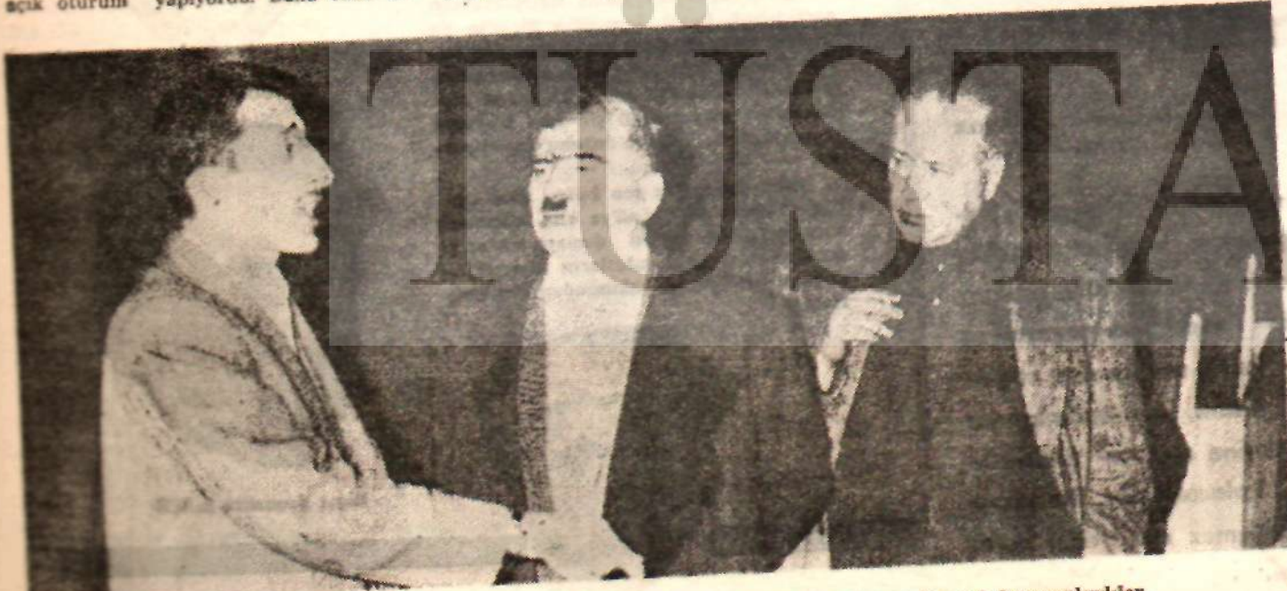
Belediyedeki toplantıda sık sık «bütün gece hrin ekmeğe siz kalabileceğini» söyleyen fırıncılar çok heyecanlıydılar