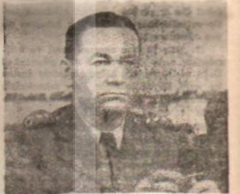
Senatör Sami Küçük

S ami Küçük, Suphi Karıman ve Vehbi Ersel tarafından bir sosyalist partisi kurulacağı hakkında Ankara'da dolayan söylentileri, ilgililer kesin şekilde yalanladı. Sami Küçük, söyletinin iki arkadaşı ile birlikte YON'un bildirisini imzalamaları yüzünden çıktığı kanaatinde.