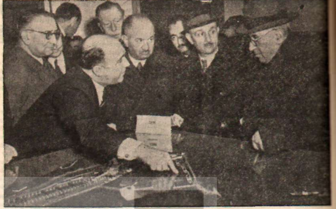
Başbakan Hasan Saka Zonguldak limanı h akında izahat ahıyor