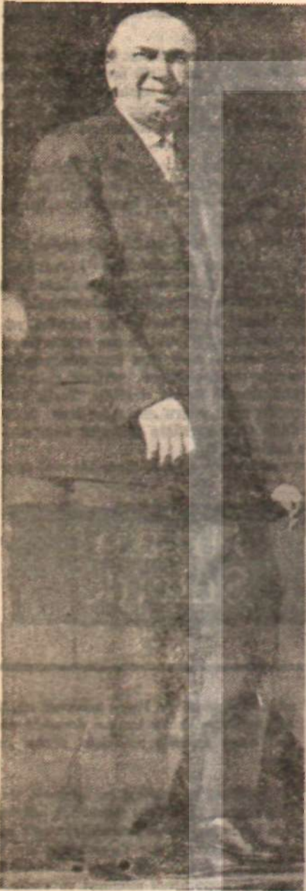
Sovyet Büyükelçisi Rijov

B üyük Elçi Rijov'un Başbakanı ve bakanlara yaptığı esrarengiz ziyaretleri örten esrar perdesi, Başbakan yardımcısı Akif İyidoğan tarafından aralandı. İyidoğan, Sovyetlerin yardım teklifinde bulunduğunu söyledi. Sovyetler, zıral mahsul satışlarıyla ödenmek üzere, uzun vadede, düşük faizli yatırım kredileri vereceklerdi. Yardımın şarta bağlı olup olmadığı belli