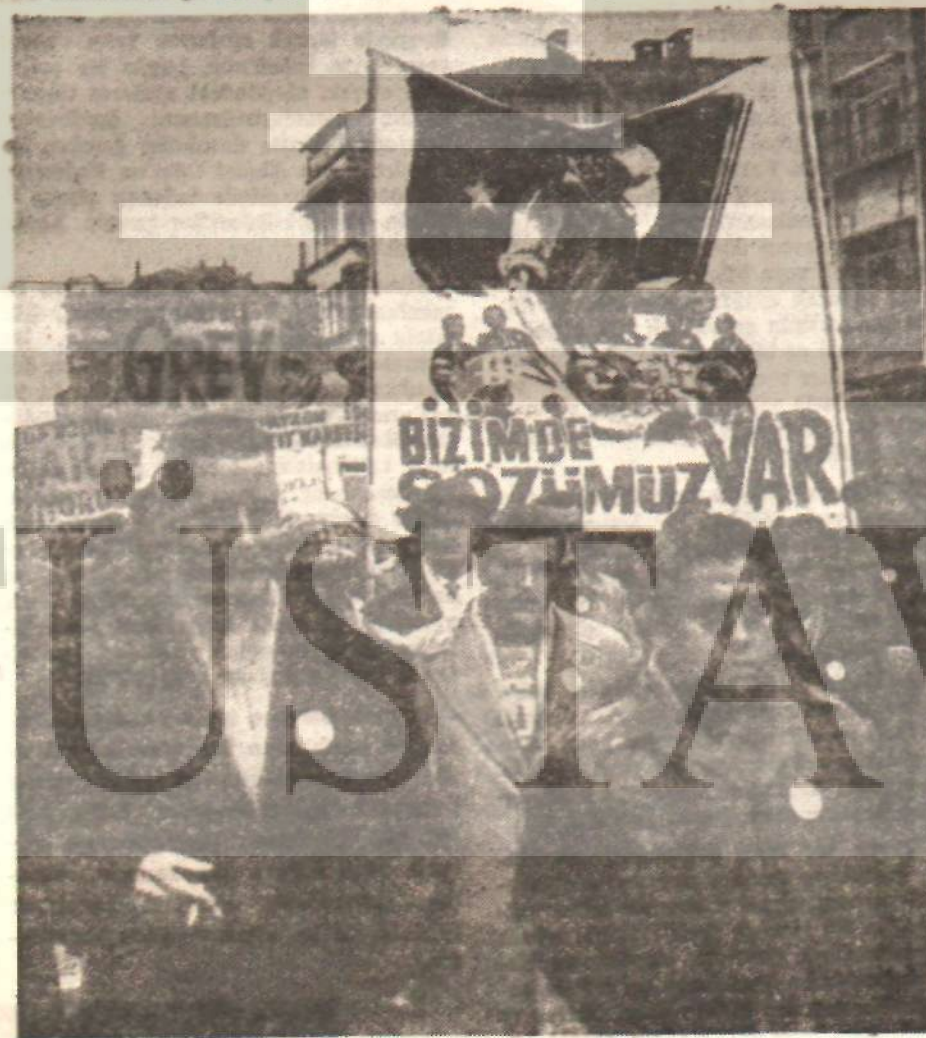
«Bizim de sözümüz var» diyen işçi, mitingde sesini duyurdu.