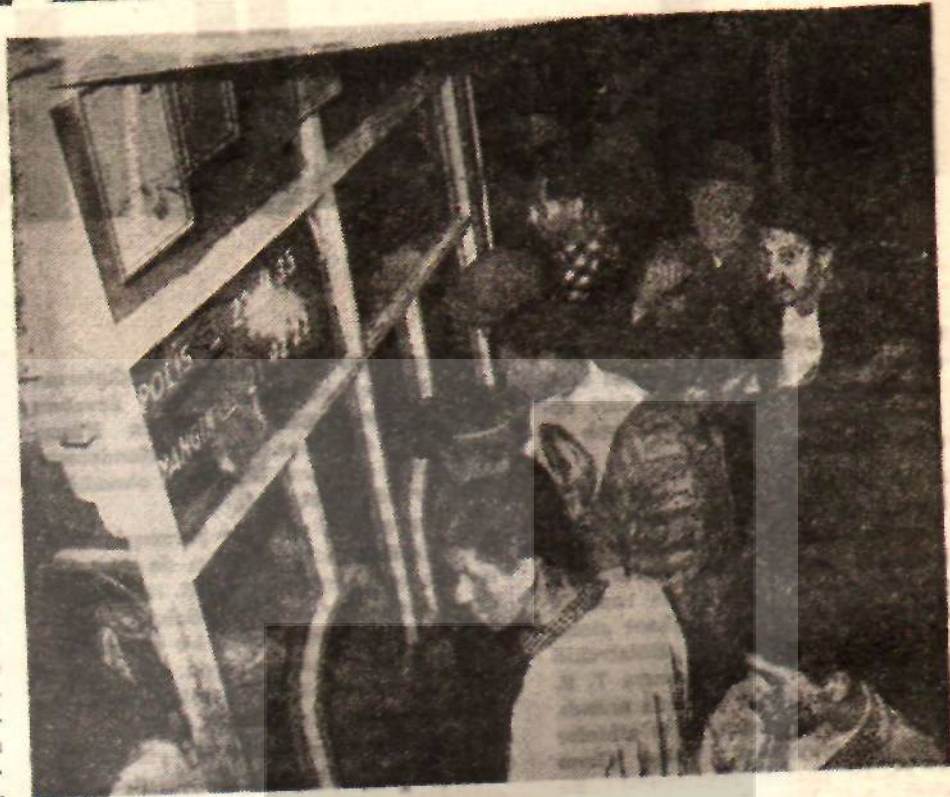
İstanbullular fırın önünde ekmeğe için savaşıyor

M aliyet hesaplarını gösteren cetveller karşılıklı masaların üzerine serildi. Hesaba esas alınan, 24 çuval unun işlenmesiydi. Belediye 14 işçi çalıştırılmakla bunun işleneceğini kabul ediyor, fırıncılar ise 16 işçi çalıştırdıklarını ileri sürüyorlardı. Her fırında 8 hamurkâr, 2 pişirici, 2 tezgâhtar, 4 çırak vardı. Belediye ise çırakları 2 olarak kabul ediyordu. Fırıncılara işçi Sigortaları Kurumundan alınan bordrolar gösterildi. Fırıncıların çoğunda çalıştırılan işçi sayısı 14'ün altındaydı. Buna fırıncıların bulduğu karşılık şöyleydi: «Biz devamla çalışacak işçi bulamayız ki, diyorlardı. Ancak kıyın kadromuz dolar, yazın çoğu bırakıp köylerine giderler. Bir çoğu da bugün gelir, bir kaç ay çarşur