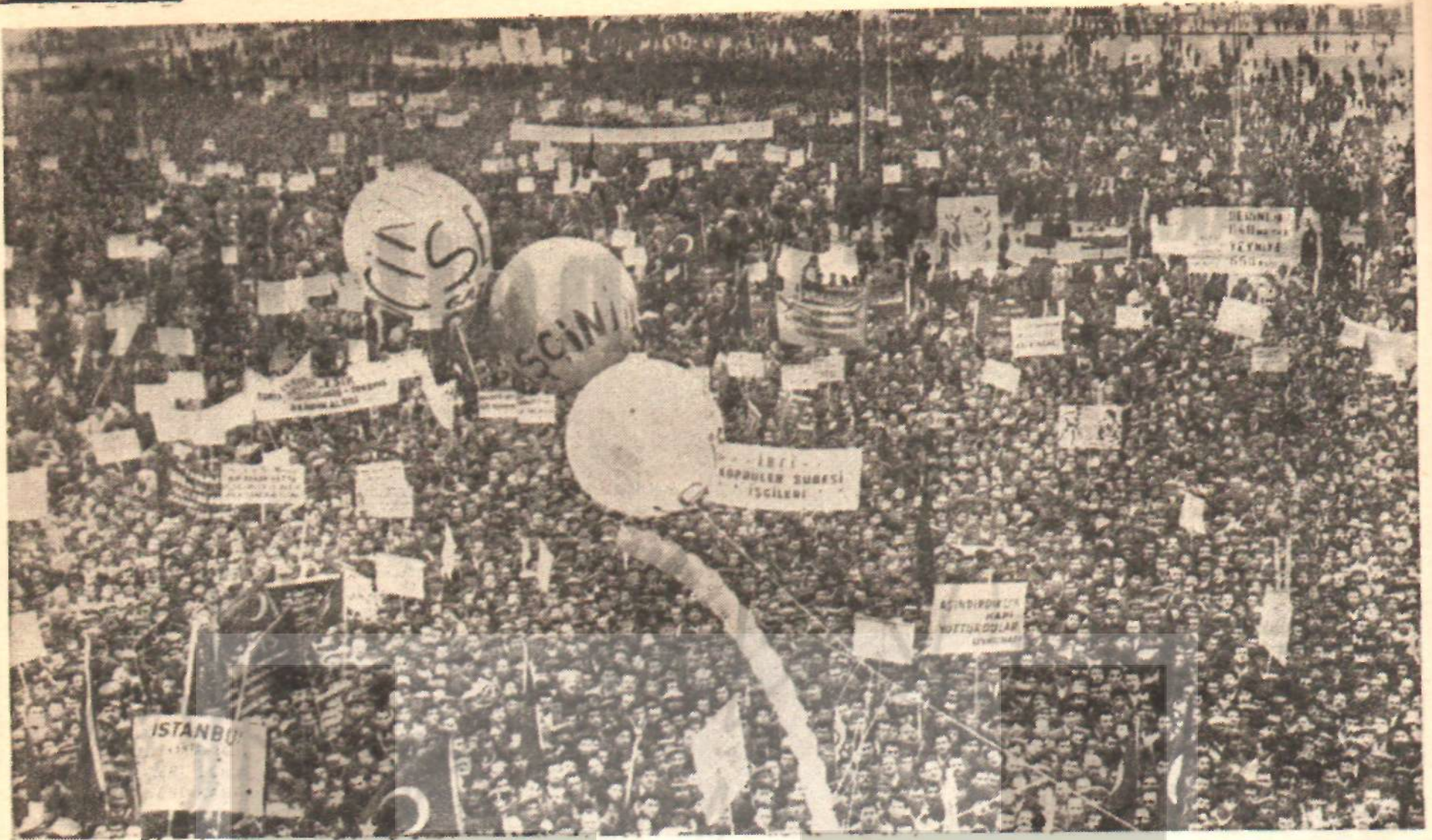
Sarayhanebası'ndaki mitinge 100 binden fazla işçi katıldı. Bu, Türk işçisinin sosyal haklarını alma konusundaki ilk büyük hareketiydi.